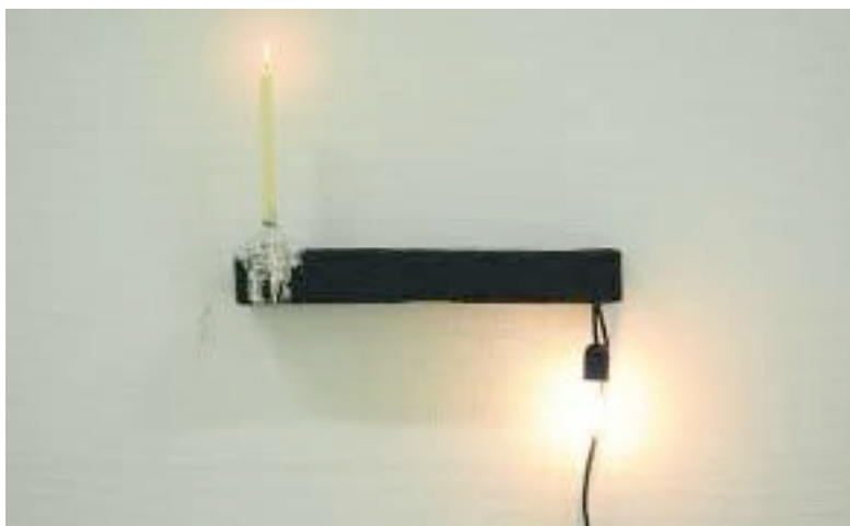
URO: Anders Ruhwald skaper en uro med sine flertydige objekter.